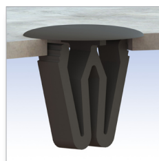
Su foro Ø 14,5 mm. On hole 14,5 mm.