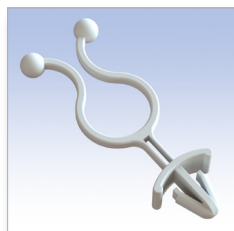
Tipo 1 - Type 1